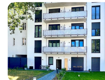
Berlin-Lichtenberg, Einbeckerstr. 31

Energetische Sanierung eines Mehrfamilienhauses und Dachaufstockung zur Schaffung von neuem Wohnraum