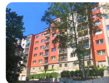
Berlin-Kreuzberg, Methfesselstr. 29/31

Energetische Sanierung eines Mehrfamilienhauses und Dachaufstockung zur Schaffung von neuem Wohnraum