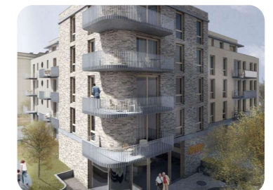
Stuttgart-Untertürkheim, Biklenstr. 10

Neubau, Studentenapartments "Study & Living"